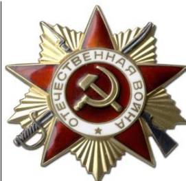
Орден «Отечественной Войны 1 степени»