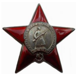
Орден «Красной звезды»