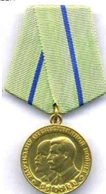
Медаль «Партизану Отечественной войны 2 степени»