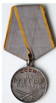
Медаль «За боевые заслуги»