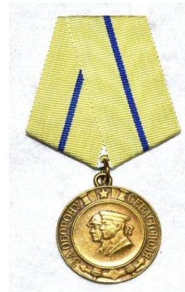
Медаль «За оборону Севастополя»