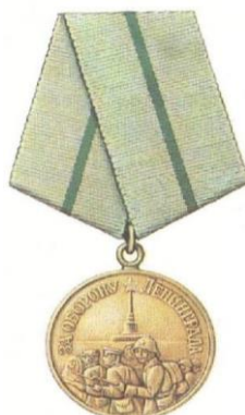
Медаль «За оборону Ленинграда»