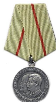
Медаль «Партизану Отечественной войны 1 степени»